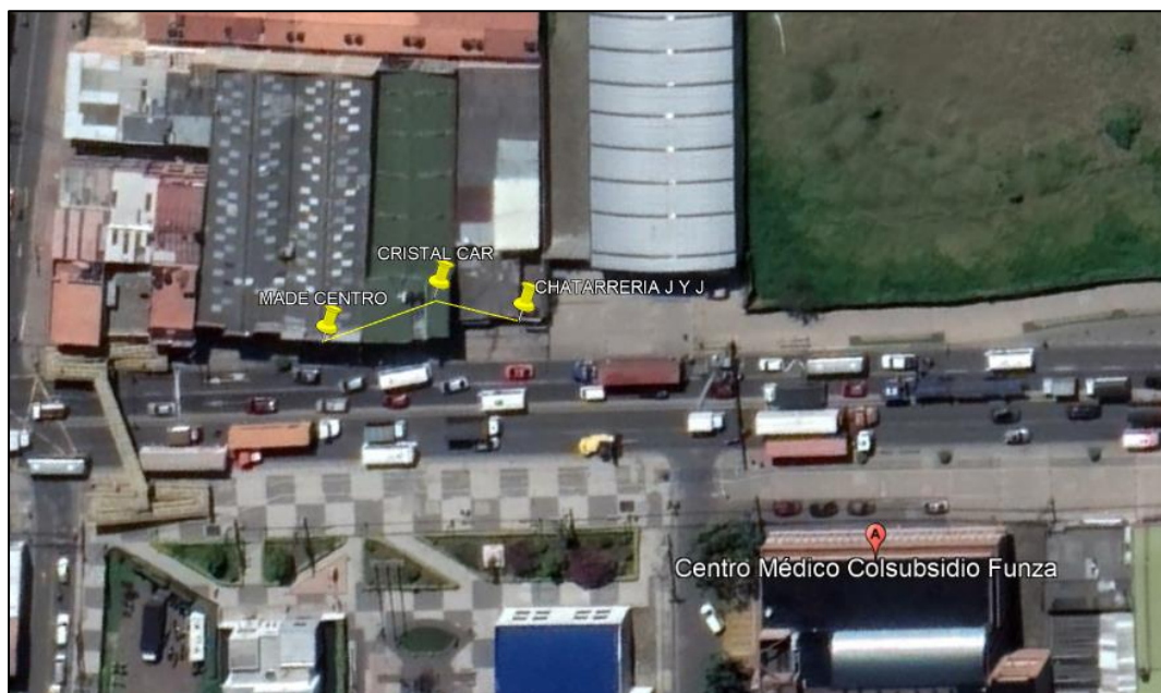
Ilustración 1. Ubicación de predios

Teniendo en cuenta que ante el municipio de Funza se interpuso queja por disposición inadecuada de residuos, el personal adscrito a la Secretaría de Ambiente y Bienestar Animal realizó vistas de control y vigilancia (Ruta amarilla) en el barrio México, con el fin de dar a conocer a los establecimientos comerciales: Chatarrería J Y J, Cristal Car y Made Centro los comportamientos contrarios a la limpieza y recolección de residuos, así como las medidas correctivas a aplicar en caso de incurrir en alguno de dichos comportamientos. Se realizaron visitas el día 15 de abril del presente año, en las coordenadas 4°42'55,254" N- 74°12'20,364" W hasta las coordenadas 4°42'55,734" N- 74°12'19,494" W como se muestra en la siguiente ilustración: