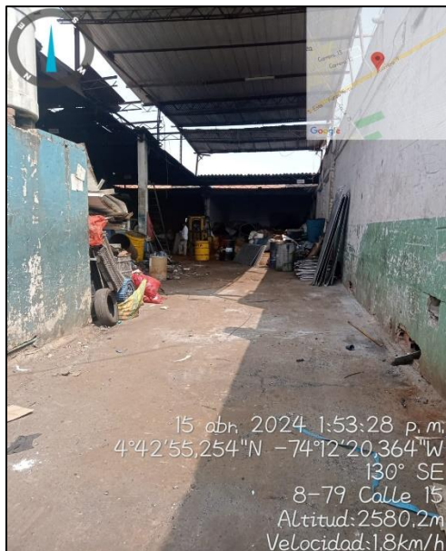
Ilustración 2. Visita de control área comercial

-Arrojar basura, llantas, residuos o escombros en el espacio público o en bienes de carácter público o privado.