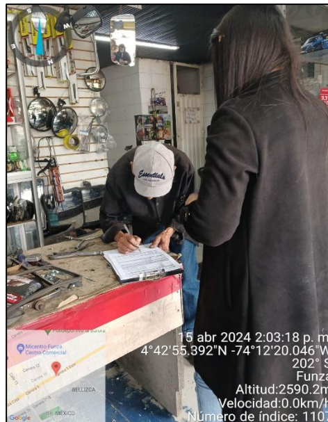
Ilustración 3. Visita de control área comercial